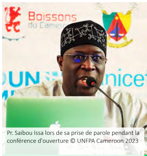
Pr. Saibou Issa lors de sa prise de parole pendant la conférence d'ouverture