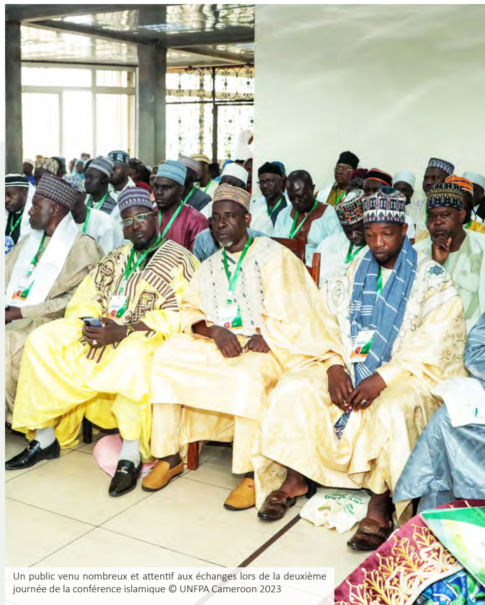
Un public venu nombreux et attentif aux échanges lors de la deuxième journée de la conférence islamique