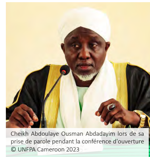
Cheikh Abdoulaye Ousman Abdadayim lors de sa prise de parole pendant la conférence d'ouverture