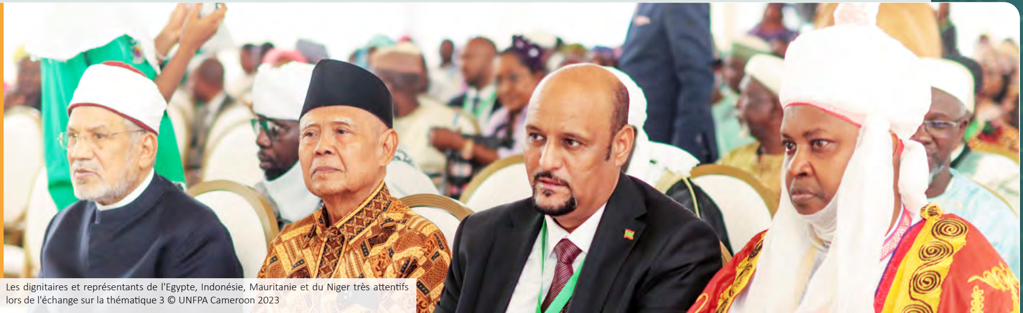
Les dignitaires et représentants de l'Égypte, Indonésie, Mauritanie et du Niger très attentifs lors de l'échange sur la thématique 3

Trois principaux intervenants ont animé la session.