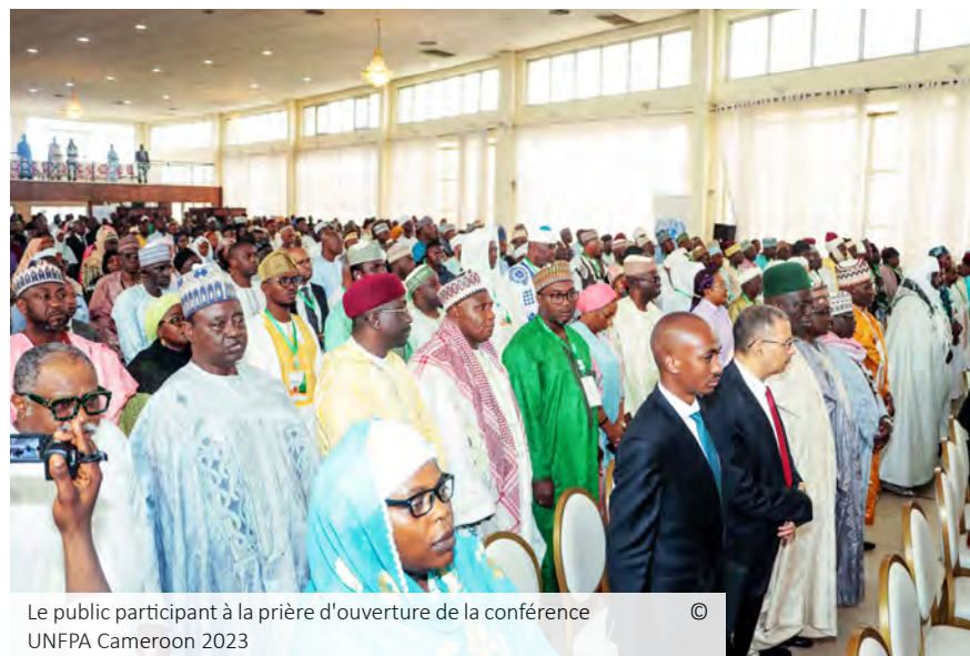
Le public participant à la prière d'ouverture de la conférence UNFPA Cameroon 2023