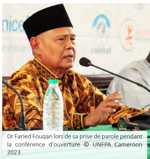
Dr Faried Fouqan lors de sa prise de parole pendant la conférence d'ouverture