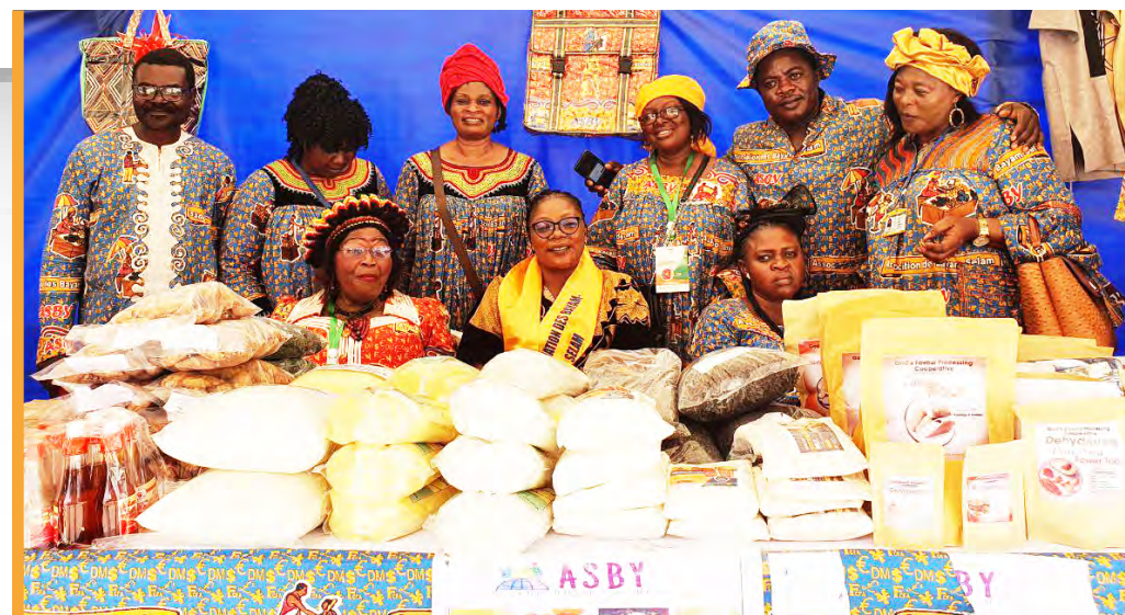
Association des Bayam-Sellam du Cameroun (ASBY) présentant leurs productions agricoles au village de la conférence islamique