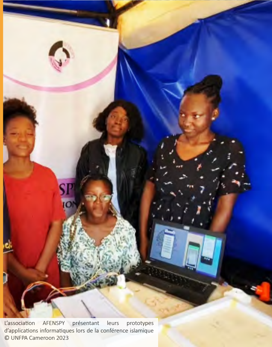
L'association AFENSPY présentant leurs prototypes d'applications informatiques lors de la conférence islamique

Le première présentation a été faite par Pr Honoré Mimche ( IFORD, Yaoundé) et porte sur le thème : "Emploi des jeunes, stabilité sociale et paix en Afrique" .