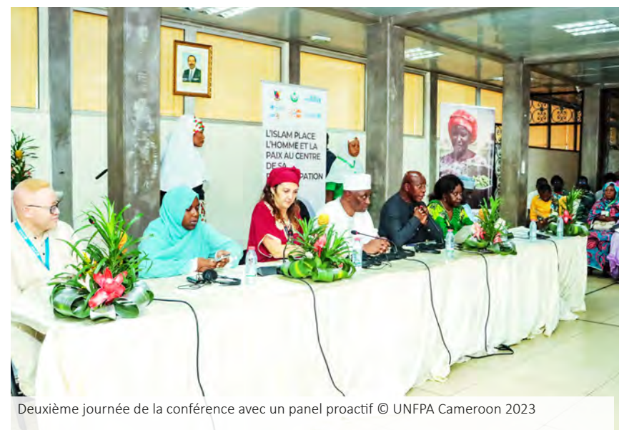
Deuxième journée de la conférence avec un panel proactif