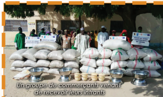
Un groupe de commerçants venant de recevoir leurs intrants