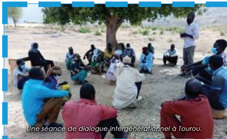
Une séance de dialogue intergénérationnel à Tourou.