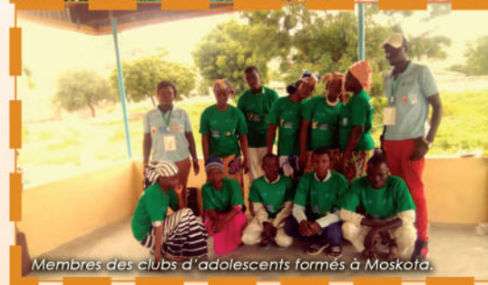
Membres des clubs d'adolescents formés à Moskota