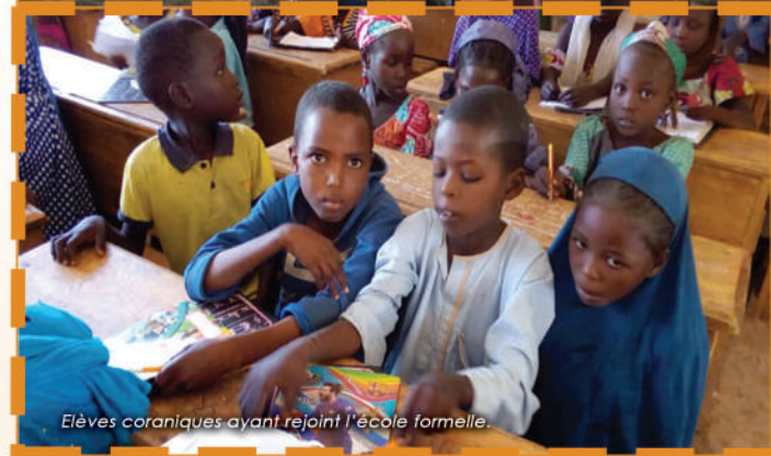
Elèves coraniques ayant rejoint l'école formelle.