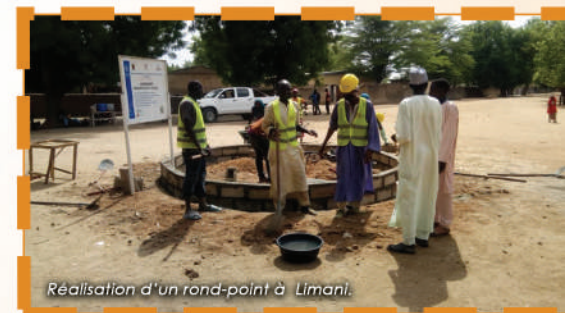
Réalisation d'un rond-point à Limani.