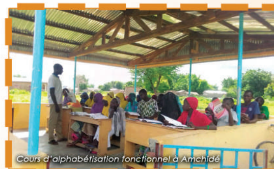
Cours d'alphabétisation fonctionnel à Amchidé