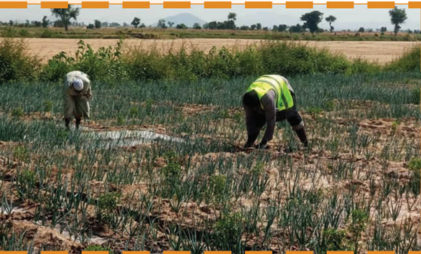
Formation à la culture d'oignons.