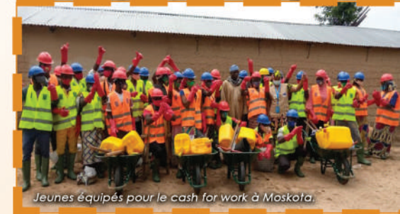
Jeunes équipés pour le cash for work à Maskota.