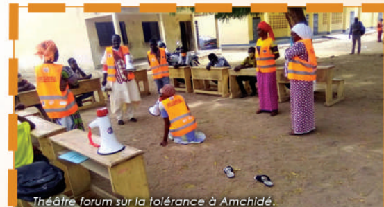
Théâtre forum sur la tolérance à Amchidé.