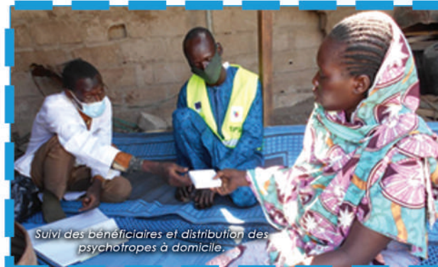
Suivi des bénéficiaires et distribution des psychotropes à domicile.