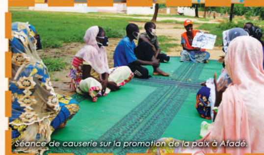
Séance de causerie sur la promotion de la paix à Atadé