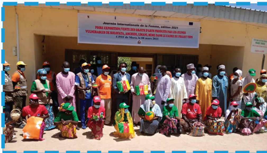
Photo de famille à l'issue de la cérémonie officielle de la foire exposition/vente des jeunes organisée à Mora à l'occasion de la journée internationale de la femme le 8 mars 2021 avec certains jeunes vulnérables à l'extrémisme violent réintégrés dans leur communauté de Kolofata, Amchidé, Limani et Mémé