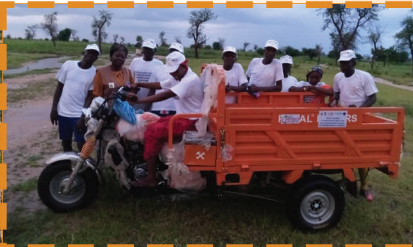
Un groupe de conducteurs venant de recevoir leur tricycle.