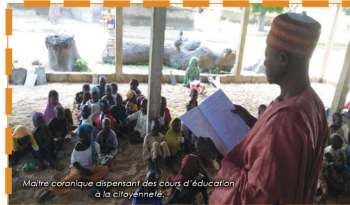
Maître coranique dispensant des cours d'éducation à la citoyenneté.