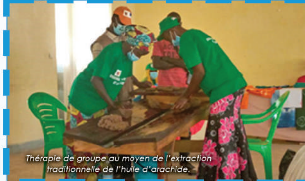
Thérapie de groupe au moyen de l'extraction traditionnelle de l'huile d'arachide.