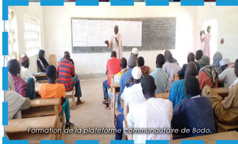
Formation de la plateforme communautaire de Bodo.